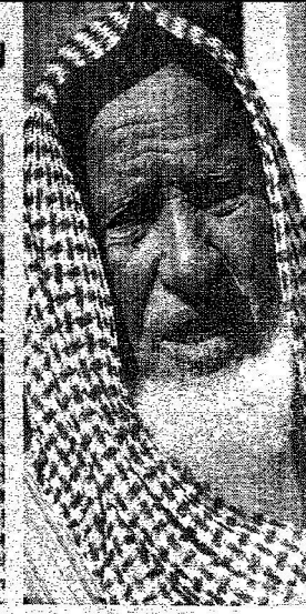
سعود بن عبدالعزيز آل سعود