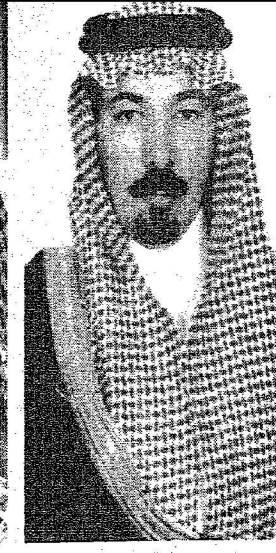
فهد بن عبدالعزيز آل سعود