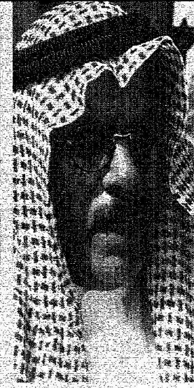
عبدالله بن عبدالعزيز آل سعود