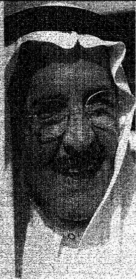
فهد بن عبدالعزيز آل سعود (الملك)