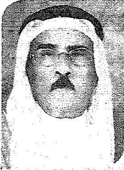
الشيخ/ عبدالعزیز العجلان