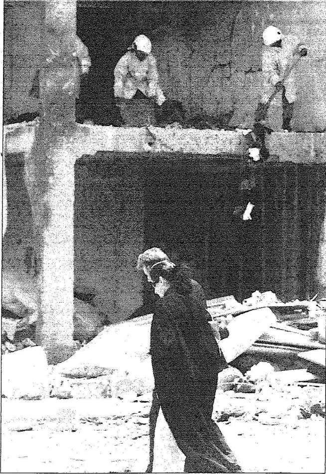
جانب من تدمير المجمعات السكنية في الرياض