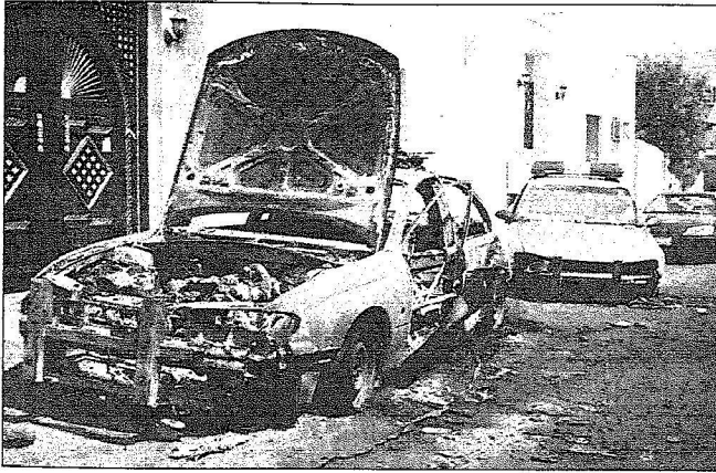
جانب من الدمار الذي أحدثته الأعمال الإرهابية