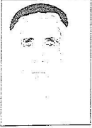
محمد آل سعد

أخصوصية ملك وخصوصية شعب وخصوصية وطن) ومن هنا يجب أن نقرأ قرار خادم الحرمين الشريفين الكريم بتعيين ابنه صاحب السمو الملكي الأمير مشعل أميراً لمنطقة نجران، تعيين للتجديد والتطوير ولخدمة الوطن. فمنطقة نجران وترافقها وحضارتها وجميع سكانها وموقعها الجغرافي البارز في آيات الذكر الحكيم، وفي راحة البحور، وفي أعذار تمور نخيلها وفي قمم جبالها وسهول أوديتها، تكف راحة سيوف الولاء ومنتخبة خيول الأمل تنظر إلى شروق جديد وعند سعيد، أشعل أنوار دأبو مشعل بعقل الخير، هذا الأمير الشاب الذي تنتظر نجران عنه الكثير، ولعلني أختصر مطالب نجران بما كلفه به والده الوطن، وكان الله في عون من كلفه عهد الله بن عبد العزيز بشيء له علاقة بالمواطن، كان الله في عونك يا صاحب السمو.