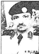
العقيد علي الشجري

فيما قال رئيس فرع هيئة التحقيق والإعلاء العام في منطقة نجران سعد بن عايض الشهراني: لقد سعدنا بالثقة الملكية بتعيين صاحب السمو الملكي الأمير مشعل بن عبدالله بن عبد العزيز آل سعود أميراً لمنطقة نجران، وإنما نبارك له هذه الثقة ونرحب به في نجران التاريخ والحضارة، نجران الأصالة، نجران عروس الربع الخالي على الوطن. إن تعيين صاحب السمو الملكي الأمير مشعل بن عبدالله سوف يظفر بالمنطقة إلى الرقي والتقدم وذلك لما لمنطقة نجران من مقومات استثمارية وتنموية بحيث تجتمع فيها تضاريس الطبيعة الجبلية والصحراوية، وتمتدح فيها أصالة المنطقة وعمق الانتماء، وإنما نعاهد الله عز وجل ثم نعاهد سموه الكريم أن تقف بجانبه لدفع منطقة نجران للتقدم والرقي.