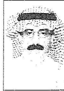
تركي آل صعب