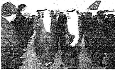
الملك عبد الله لدى وصوله مطار مدريد ويبدو الأمير سعود بن نايف.