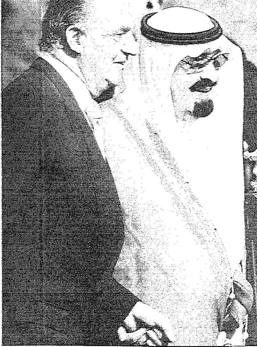
الملك خوان كارلوس يصحب خادم الحرمين إلى مقر إقامته عقب اختتام مراسم الاستقبال في المطار ■ وويتريز