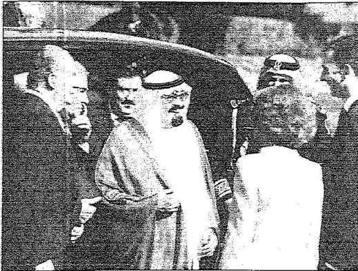
الملكة صوفيا وسمي ولي العهد يرحبان بخادم الحرمين لدى وصوله مقر إقامته في القصر الملكي ايل باردو