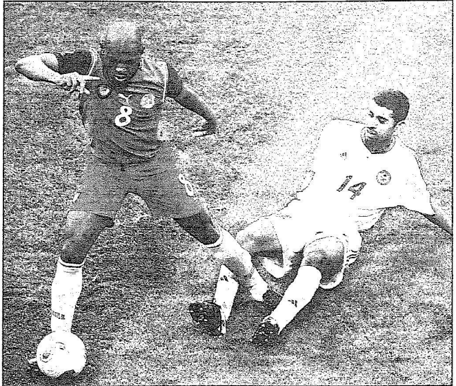
من لقاءات الاخضر المندبالية