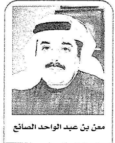
معن بن عبد الواحد الصايح

تحتزن الشعوب في ذاكرتها الأيام الحاسمة في تاريخها تلك الأيام التي تعتبر منعطفاً مهماً في وحدتها وانطلاقتها ورسم ملامح مستقبلها، واليوم الوطني للمملكة هو اليوم الذي أعلن فيه الملك عبد العزيز يرحمه الله توحيد هذا الكيان الكبير تحت راية التوحيد ووضعا أسس بناء الدولة الحديثة التي تعيش اليوم في أركانها أمين مطمئنين ننعم فيها بالرخاء في ظل قيادة واعية ذات رؤية واضحة لصناعة مستقبل زاهر يعزز منجزاتنا الحضارية ويرسم