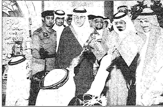
مجموعة من طلاب ومطالبي رنية يستقبلون أمير مكة بشهد ترحيبي

القضاء على الفساد الإداري والتخاذل والجهل ينقلنا من العالم الثالث للأول