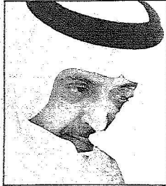
الامير عبدالله بكفكف دموعه لغراق شقيقه

الملك الامير عبدالعزيز بن فيصل بن عبدالمجيد وصاحب السمو الملكي الامير تركي بن فيصل بن عبدالمجيد واصحاب الفضيلة العلماء والمشايخ واصحاب المعالي الوزراء وكبار المسؤولين وجمع من المواطنين وعقب الصلاة تقبل خادم الحرمين الشريفين العزاء من اصحاب السمو الملكي الامراء واصحاب الفضيلة العلماء واصحاب المعالي الوزراء وجموع المصلين.