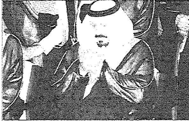
سمو ولي العهد يدعو للفقيد بالرحمة

و نائب حاكم الشارقة والشيخ ناصر صباح الأحمد وزير شؤون الديوان الأميري بدولة الكويت وأصحاب سمو الملكي الإمرء. كما أدى الصلاة التي أمها ساحة مقفى عام الملكة الشيخ عبدالعزيز بن عبدالله الإمرء فيصل بن عبدالمجيد بن عبدالعزيز وصاحب السمو