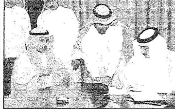
معملي الوزير يوقع عقد الطريق السطحي السريع مع مؤسسة ابن جابر الله

« بند مصبي وزير اسس اسسومو جبارة بن عبد الصريمصرى حرص وزارة النقل على تنفيذ مشروعاتها بأسرع وقت ممكن وحث معاليه المقاولين المتفنين لمشروعات الوزارة بالعمل على التزام الأوقات المحددة كذلك مشيراً إلى أنهم شركاء مع الوزارة في العمل التنموي. وأشار معاليه عقب توقيع خمسة عشر مشروعاً للطرق صباح أمس بمبلغ إجمالي ١٧,٨٧٦,٤٧٦,٧٨٥ ريالاً إلا أن إنشاء وتنفيذ الطرق