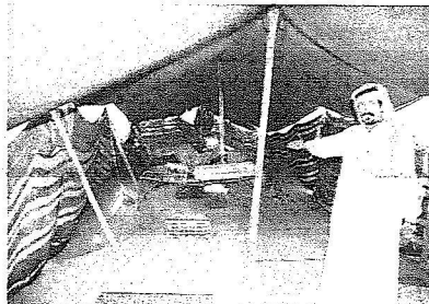
مستفيد من المشروع يشير إلى خيمته.