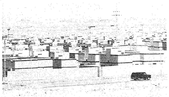
جانب من مشروع مؤسسة الملك عبد الله لوالديه في غزالة حائل.