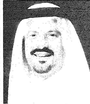
الأمير سعود بن عبد المحسن

نباية عن خادم الحرمين الشريفين الملك عبد الله بن عبد العزيز رئيس مؤسسة الملك عبد الله بن عبد العزيز لوالديه للإسكان التنموي - حفله الله - اليوم السبت يدشن الأمير سعود بن عبد المحسن بن عبد العزيز أمير منطقة حائل مشروع المؤسسة في "محافظة الغزالة" 90 كيلومترا جنوبي منطقة حائل. ويسلم أمير حائل في هذا الحفل وثائق التخصيص للمواطنين المرشحين، وكذلك مفاتيح المنازل، والبالغ عددها (254) منزلاً، سيستفيد منها (1778) مواطناً وبلغ مساحة الوحدة السكنية (396) متراً مربعاً بتكلفة 60 مليون ريال.