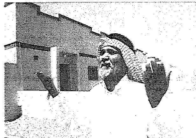
مواطن يلهج بالدعاء لخادم الحرمين .