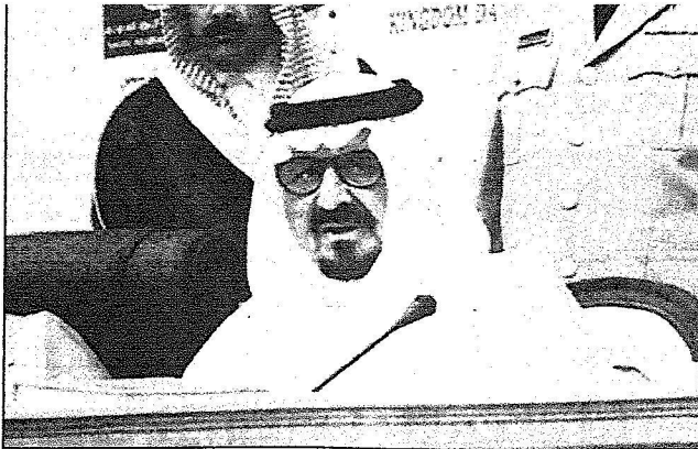
سموه يلقي كلمته

المصدر : الرياض التاريخ : 11-05-2006 العدد : 13835 الصفحات : 2 المسلسل : 8