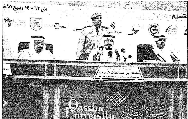
الأمير سلطان خلال زيارته للقائه الدولي

سموه وضع حجر الأساس لمشروعات تعليمية ورياضية بتكلفة ٣٧٠ مليون ريال