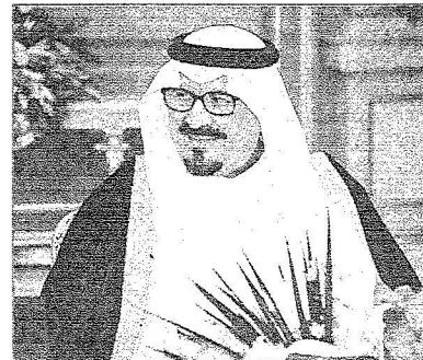
نائب الملك لدى رئاسته جلسة مجلس الوزراء أمس

كما أطلع نائب خادم الحرمين الشريفين المجلس على الاتصالات والمشاورات واللقاءات التي أجراها خادم الحرمين الشريفين وسموه الكريم خلال الفترة الماضية مع كبار ضيوف المملكة من أصحاب الجلالة والسمو ومبعوثيهم التي تناولت العلاقات الثنائية بين المملكة وتلك الدول التي جانب القضايا الإقليمية والدولية وفي مقدمتها ما يخص الأوضاع بمنطقة الشرق الأوسط. وأوضح وزير الدولة عضو مجلس الوزراء لشؤون مجلس الشورى وزير الثقافة والأعلام بالنيابة الدكتور سعود بن سعيد المحمدي في بيانه لوكالة