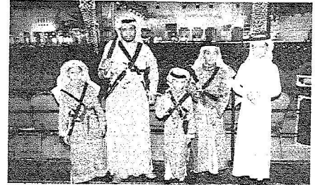
زي العرصة الجميل