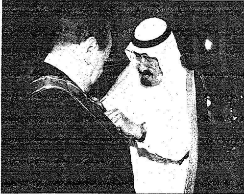
خادم الحرمين يقد براسكوني وشاح الملك عبد العزيز