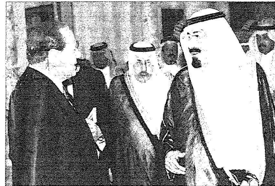
الملك و برلسكوني أثناء الاستقبال

مجلس الوزراء وزير الداخلية، وصاحب السمو الملكي الأمير خالد الفيصل بن عبدالعزيز أمير منطقة مكة المكرمة، وصلاح السمو الملكي الأمير مقرن بن عبدالعزيز رئيس الاستخبارات العامة، وصاحب السمو الملكي الأمير مشعل بن ماجد بن عبدالعزيز محافظ جدة،