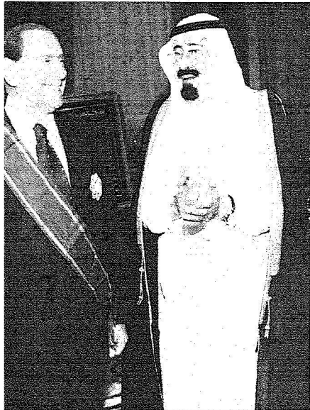
الملك يحيي ضيفه بعد تقليده الوساح

وخلال الاستقبال رحب خادم الحرمين الشريفين الملك عبدالله بن عبدالعزيز آل سعود بدولة رئيس مجلس وزراء إيطاليا سلفيو برلسكوني في المملكة العربية السعودية متمنياً له ولعراقه طيب الإقامة في المملكة. من جهته أعرب بولته عن شكره وتقديره للملك المفدى على ما وجهه ومرافقوه من حسن استقبال وكرم ضيافة وأقام خادم الحرمين الشريفين في قصره بجدة مساء أمس مأدبة عشاء تكريماً لرئيس مجلس وزراء إيطاليا سلفيو برلسكوني والوفد المرافق له.