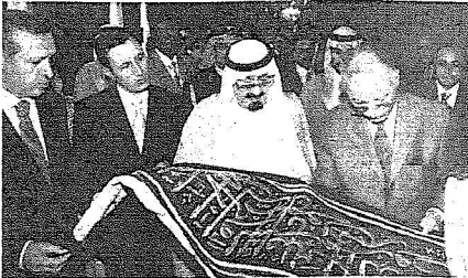
خادم الحرمين يهدي المركز قطعة من كسوة الكعبة