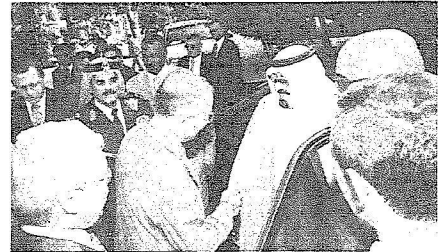
أوغلو في مقدمة مستقبلي خادم الحرمين الشريفين خلال زيارته للمركز الثقافي الإسلامي

ثم شاهد الملك المفدى ودولة رئيس الوزراء التركي فلماً عن