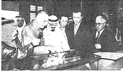
ويستمع إلى شرح وافٍ من أوغلو عن إحدى المخطوطات التاريخية