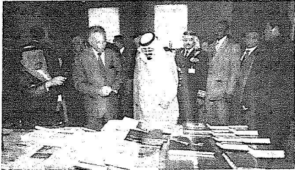
□ الصور من واس ويطلع على ما يحتويه المعرض من مؤلفات تاريخية