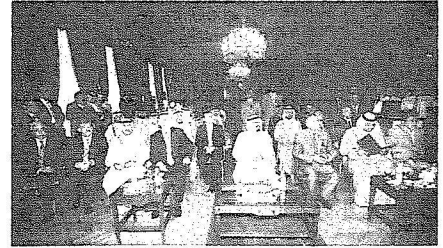
خادم الحرمين يشاهد فيلمًا عن نشاطات مركز الأبحاث للتاريخ والفنون والثقافة الإسلامية بـاستنبول □ واس