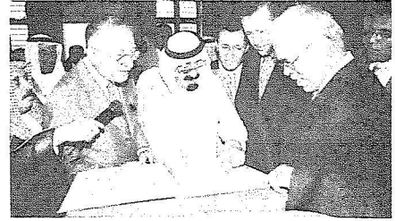
ويطلع على إحدى الخزائن والمخطوطات