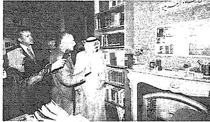
خادم الحرمين يتجول في المركز الثقافي الإسلامي