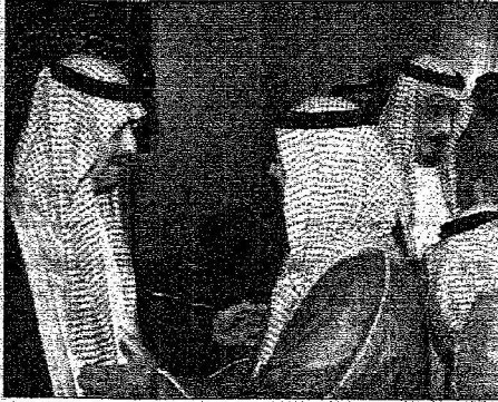
الأمير سلمان بن عبدالعزيز والأمير سلطان بن فهد بنطلق آل سعود في قصر الحكم بالرياض