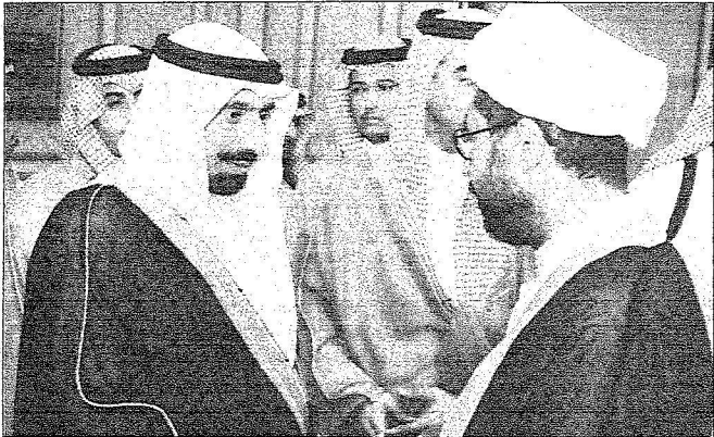
نائب أمير المنطقة الشرقية يستقبل الحزينين والبعثيين

الشريفيين الملك عبد الله بن عبد العزيز وسمو ولي عهده الأمين صاحب السمو الملكي الأمير سلطان بن عبد العزيز. وشهدت تربة، إصرار شيخ فوق التسعين على العزاء والمياعة بنفسه. كما شهدت إصرار صبي في السابعة من عمره، يدعى عبدالله البقمي، على مرافقة والده في العزاء والمياعة. وفتحت المحافظة أبوابها لليوم التالي، وتولى المحافظ مهدي العياشي تلقي العزاء والمياعة من المواطنين.