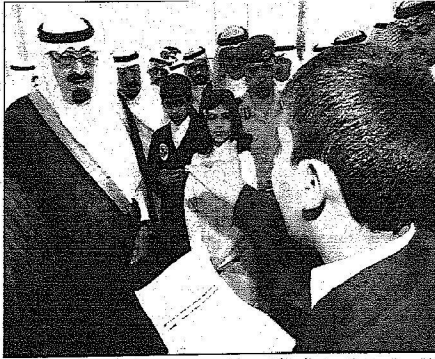
الملك عبدالله بن عبدالعزيز آل سعود يكرم أحد الأطفال