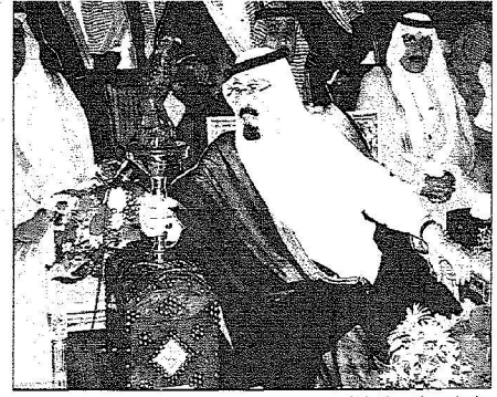
الملك عبدالله بن عبدالعزيز آل سعود يكرم أحد الأطفال

25 مليون ريال لتنفيذ المرحلة الأولى من مشروع الإسكان التنموي في رفحاء