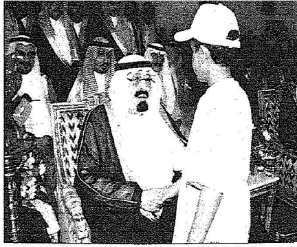
الملك عبدالله بن عبدالعزيز آل سعود يكرم أحد الأطفال