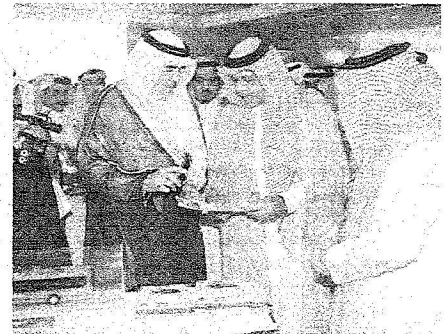
وزير الحج خلال افتتاح الجلسة