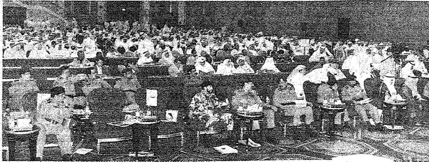
تصوير: عبدالله آل محسن