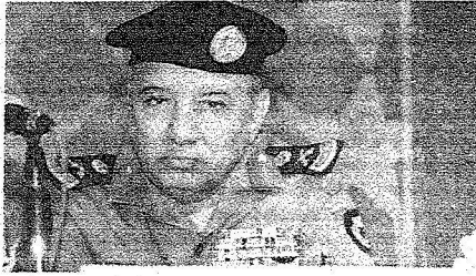
الواء علي النفيعي قائد قوات أمن الحج

تستقيا مع بعثات الحج من الدول الإسلامية بمواعيد التفويض وهناك غرفة للتحكم والسيطرة تتابع وبشكل مباشر حجاج الخارج والداخل وشركات الحج وكما نجح حج العام الماضي بإذن الله سينجح حج هذا العام بتضافر الجهود وبوعي الحاج والمامة بالتعليمات والإرشادات . وفيما يتعلق بحجاج الداخل قال : إنه تم الترخيص لما يزيد عن مائتين وخمسين وعشرين شركة داخلية والوزارة خصصت رقم مجاني لكل من يطلب معلومة عن تلك الشركات ، مشيراً إلى أن سمو وزير الداخلية وجه إمارات المناطق بالتعاون مع وزارة الحج فيما يتعلق بمحاولات التحاليل على الحجاج بشركات وهمية حيث أن هناك عقوبات شديدة ضد المتحاليلين وأفاد أن جميع أسماء الشركات موجودة في الوزارة والرقم المجاني من خلاله يستطيع أي حاج أن يتصل بالرقم ويعرف ماهي الشركات التي تقدم خدماتها في حج هذا العام .