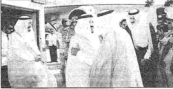
الشيخ نواف يستقبل الأمير سلطان في المطار