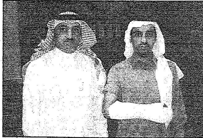
مدير المستشفى مودعاً يوم خروجه