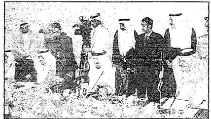
الأمير سلطان مشرئاً الجانب السعودي

ان الاتفاقيات الاخرى التي سيتم التوقيع عليها في هذه الدورة تأتي امتداداً كذلك للتعاون الإنمائي والاقتصادي والاختصاصي بين البلدين والذي ذمّل أن يسهم بشكل كبير في دفع عجلة التنمية والتكامل بين اقتصاد البلدين ويعزز الروابط المتينة بين العميين الشقيقين. وفي هذا الإطار فانهي ادعو القطاع الخاص في البلدين الى بذل المزيد من الجهود لتحقيق التكامل المنشود ولجعله حقيقة على أرض الواقع في مختلف المجالات.