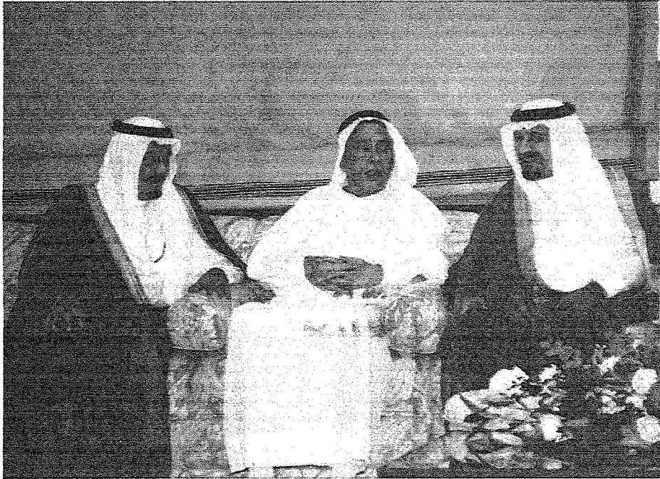
الأمير سلطان والأمير سلمان لدى زيارتهما خالد يوسف المرزوق أمس

الصباح المستشار في الديوان الأميري بقصر قرطبة.