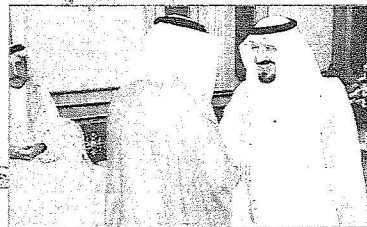
سمو الأمير سلطان يصافح أعضاء الهيئة

التاسع عشر بالرياض ما هو إلا دليل على رغبة حكومتنا الرشيدة في لم شمل الأمة العربية ووحدتها فضلاً عن