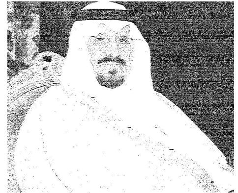
ولي العهد في لقاء سابق مع رئيس الوزراء ووزير الخارجية القطري