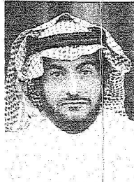
الشيخ خالد السلمي

توحدت مشاعر الجميع مسؤولين كباراً ومواطنين عاديين في وفاة فقيد الأمة خادم الحرمين الشريفين الملك فهد بن عبد العزيز - رحمه الله - معبرين عن حزنهم العميق في هذا الفقد الجلل وعدوا رحيله خسارة كبيرة ليس لشعبه فحسب بل لشعوب العالمين العربي والإسلامي قاطبة لما قام به الراحل العظيم من أعمال جليلة بخدمة للمواطنين ونصرة لقضايا الإسلام والمسلمين في كل مكان منوهين بانجازاته كياناً للنهضة الحديثة في المملكة في عصر التحولات الكبيرة التي شهدها العالم في العقود الأخيرة.