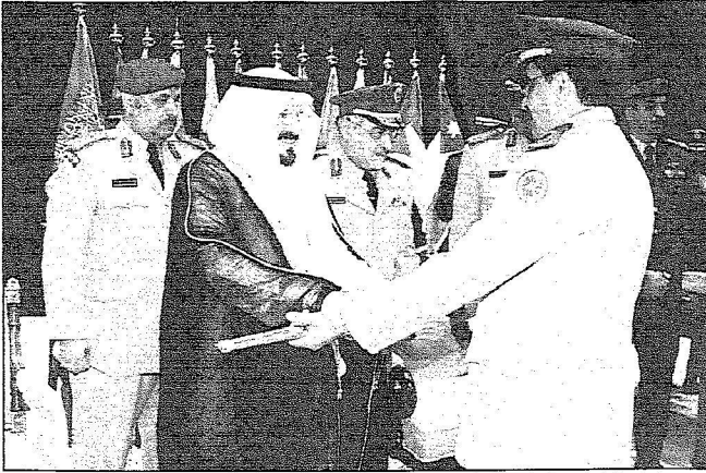
سموه يسلم أحد الخريجين بالقيادة والأركان جائزته

اعلن نائب خادم الحرمين الشريفين صاحب السمو الملكي الامير سلطان بن عبدالعزيز عن توجيه خادم الحرمين الشريفين القائد الاعلى لجمع القطاعات العسكرية عن انشاء كلية الحرب في الملكة العام القادم وكلية فنية تابعة للقوات المسلحة وقال سمو نائب الملك خلال تشريفه مساء امس حفل كلية القيادة والأركان للقوات المسلحة بتخريج الدورة الثالثة والثلاثين للقيادة والأركان ودورة التخطيط في المستويين الاستراتيجي والعملياتي اننا نملك الان أربع كليات وكذلك كلية القيادة والأركان ومماهد عسكرية متميزة والبشرى الحقيقية أن لدينا عددا من الضباط الأفاضل الذين أخذوا شهادات كلية الحرب الذين سيقوم عليهم وعلى أكتافهم انشاء كلية الحرب ان شاء الله. وقال سموه في اجابته للصحفيين