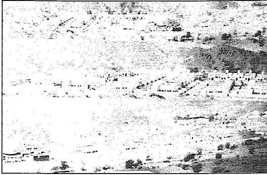
منظر لكامل مشروع بييس الاسكاني