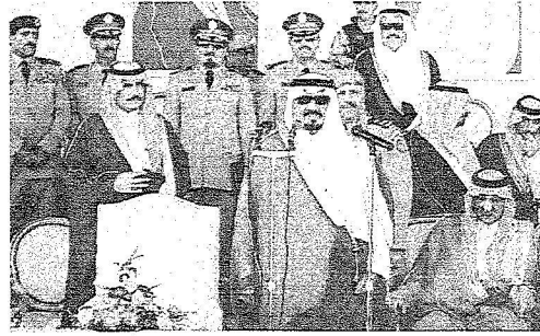
الامير سلطان يخاطب منسوبي القوات المسلحة وقوة درع الجزيرة