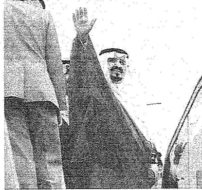
سموه يلوح بيده الكريمة لدى مغادرته قاعدة الملك عبدالعزيز الجوية

ايها الاخوة باسم زملائي واخواني وزراء الدفاع في مجلس التعاون الخليجي احببكم جميعا بتحية الإسلام واهنتكم بعيد الفطر المبارك وبارك تضامنتكم جميعا وانتلافكم جميعا وقد ضربتم التل الاعلى في الاخوة والمحية والتأخي. واستطرد سمو ولي العيد في كلمته قائلا: ايها الزملاء والاخوة ان المملكة العربية السعودية هي بلد الإسلام وبلد المحبة وبلد الاخاء وبلد الدفاع عن المقدسات الاسلامية وكذلك عن دول الخليج او الدول العربية وفي مقدمتها قضية فلسطين.