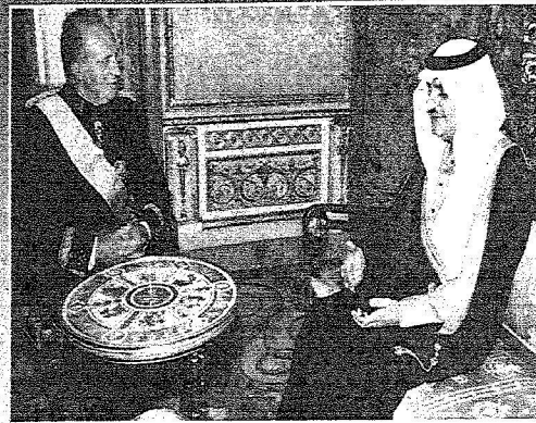
الأمير سعود، بن نايف بن عبد العزيز سابق خادم الحرمين الشريفين لدى مملكة اسبانيا لدى استقبال الملك خوان كارلوس لسومه في وقت سابق صورة أرشيفية خاصة بالرياض