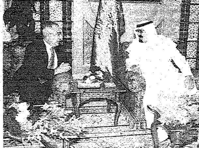
ويستقبل سلام فياض.