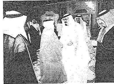
خادم الحرمين الشريفين لدى استقباله السفراء

وجل وبالعامل على تعزيز العلاقات بين المملكة والدول المعيّنين فيها وأن يكونوا خير سفراء لدينتهم ووطنهم وشعبهم من جهتهم عبر السفراء عن اعترازهم بالثقة الملكية