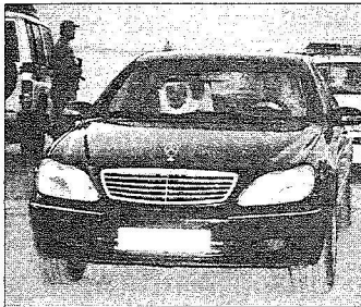
الامير سعود يقود السيارة وبرفقته وزير النقل