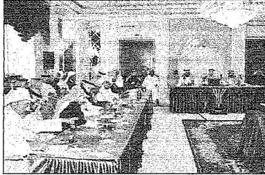
جانب من الإعلاميين

سؤالها للوفد الياباني عن دور المرأة واهتمامهم بها ورد السيد تاكادا أن هناك مشاركة في إحدى الندوات وسنحاول نقل عاداتنا وتقاليدينا. وكان السؤال عن عدم تكريم الشيباب الإعلاميين، ورد السليل أننا أمام سبيل من الأسئلة حول تكريم الشيباب والمرأة والمؤرخين وتطول القائمة لكننا نركز كل عام على فئة معينة. سؤال آخر كان عن إمكانية توثيق النشاط الثقافي في كتاب.. ورد السليل أن مسوق الوزارة يرصد الفعاليات ويوثقها لكنه لن يتوفر إلا بعد مدة.