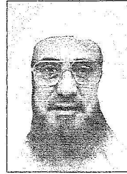
أبو عبد الرحمن بن عقيل

◆ معنا 55 دار نشر تمثل 22 دولة وتعرض 200,000 كتاب