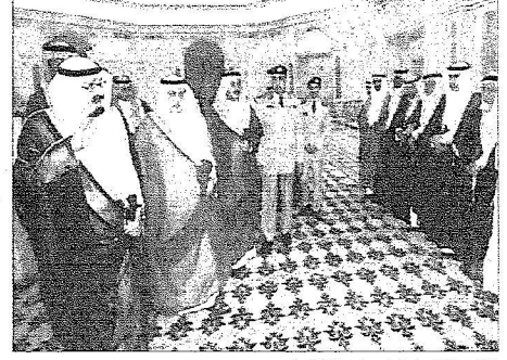
ملك عبدالله لدى استقباله وفدا من قبيلة الراددي

استقبل المفتي والعلماء ووفدا من قبيلة الراددي ووزير الصحة