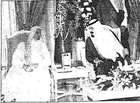
ملك عبدالله خلال استقباله المفتي والملك