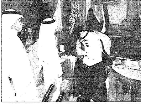
ملك خلال استقباله مجموعة من الأئمة بمناسبة حصول السعودية على شهادة من منظمة الصحة العالمية