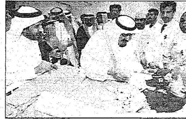
ويطمئن على صحة التؤام

جراحية استغرقت 18 ساعة وامتدت على سبع مراحل وشارك فيها حوالي 22 متخصصاً من تخصصات جراحة الأعصاب والتخدير والتجميل وجراحة الأطفال والتمريض والفنيين كما أن الفريق الطبي الذي أشرف على العملية قارب 60 عضواً. وقد استخدمت خلال العملية أجهزة جديدة مثل الجهر الجراحي والجهاز الملاحي لجراحة المخ والأعصاب وجهاز الأشعة المقطعية وجهاز ديكستر سكوب الذي يستخدم لأول مرة في الشرق الأوسط بهدف تحديد التصاق المخ والشرابين. إضافة