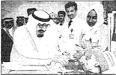
أوليفس - أحمد القرني

قام خادم الحرمين الشريفين الملك عبد الله بن عبد العزيز - حفظه الله ورحمته- أمس بزيارة أبوية للتوأيم السعودي (عبد الله وعبد الرشيد) والتوأيم الطفلي السعودي (ابتهال) والعماني (صالحا وروثة) الذين يتلقون العلاج في مدينة الملك عبد العزيز الطبية للحرس الوطني بالرياض بعد نجاح عمليات فصلهم التي أجريت لهم مؤخراً على أيدي فريق طبي وجهازي سعودي مختص. وكان في استقباله -أيده الله- فور وصوله مدينة الملك عبد العزيز الطبية للحرس الوطني بالرياض معالي المدير العام التنفيذي للشئون الصحية الدكتور عبد الله بن عبد العزيز الربيعة وأعضاء الفريق الطبي والجراحي المشارك في عملية فصل التوأيم، وعدد من المسؤولين في الشؤون الصحية للحرس الوطني.