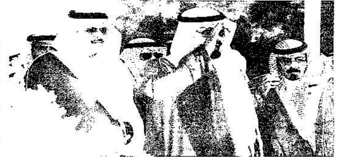
وصول الملك إلى مقر الحفل وبعواره الأمير عبدالعظيم