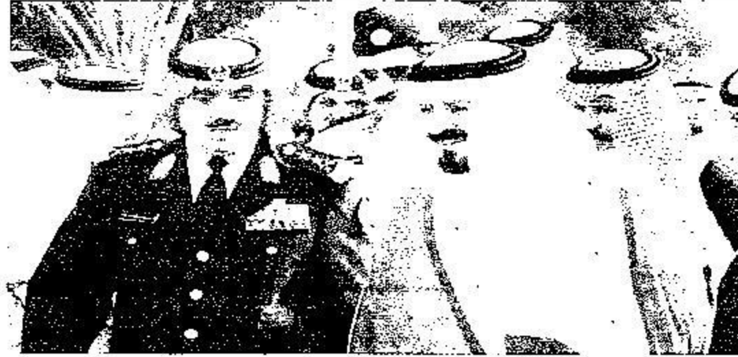
ولي العهد وحديث جانبي مع الأمير متعب بن عبدالله