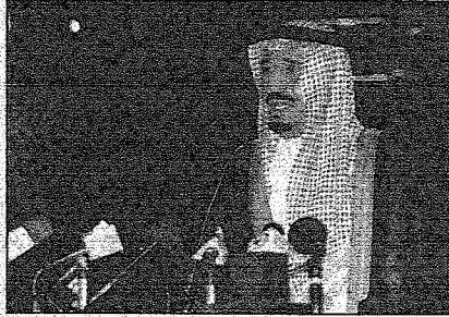
الأمير سلمان يلقى كلمته خلال الحفل

جزيل الرعاية منذ عهد الملك عبدالعزيز رحمه الله واسكنه سجود جلالته حيث أصبحت بفضل الله عاصمة تماخر كل المواسم بمشاهدها الحضارية ومعانيها الحضارية وتقدمها المستمر. وعبر عن جزيق التتكر لصاحب السمو الملكي الأمير سلمان بن عبدالعزيز أمير منطقة الرياض وثالثه صاحب السمو الملكي الأمير سلطان بن عبدالعزيز اللذين ارتبطا بمدينة الرياض وأسرها وسكانها ارتباط محبة وولاء ومحابة وتقدير وعناية ومناخفة. ولفت النظر إلى أن تحليل الأحداث التاريخية منهج درج عليه أهالي الرياض منذ عهد الملك عبدالعزيز وستة يتوارثها الاهالي ويحكونها لإرتباطهم وأحلامهم ويحسبونها واقعا عمليا يظل مع الايام يحيى صورة التلاحم ويروي حقيقة الوفاء والحب ويخلد مثل هذا اليوم المبارك.