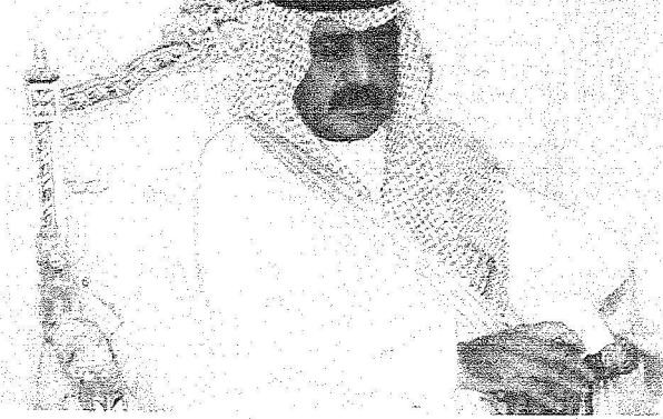
دمعة الامير مقرن عكست تلاحم ولاة الامر بالمواطنين