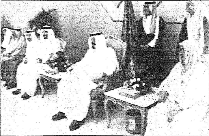
رسول تليق إلى معالي المدينة

وقد وصل في معية خادم الحرمين الشريفين صاحب السمو الملكي الأمير متعب بن عبدالعزيز وزير الشؤون البلدية والقروية وصاحب السمو الملكي الأمير تركي بن عبدالعزيز وصاحب السمو الملكي الأمير نواف بن عبدالعزيز المستشار الخاص لخادم الحرمين الشريفين وصاحب السمو الأمير فيصل بن تركي آل سعود وصاحب السمو الملكي الأمير بندر بن خالد بن عبدالعزيز وصاحب السمو الملكي الأمير ممدوح بن عبدالعزيز وصاحب السمو الملكي الأمير عبداللّه بن عبدالعزيز وصاحب السمو الملكي الأمير عبدالمجيد بن عبدالعزيز أمير منطقة مكة المكرمة وصاحب السمو الأمير