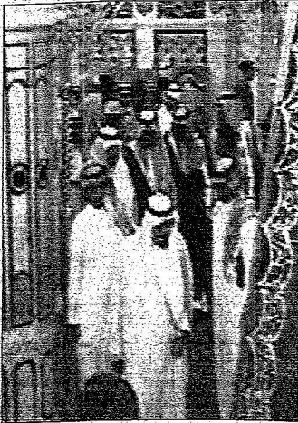
وصول خادم الحرمين إلى المسجد