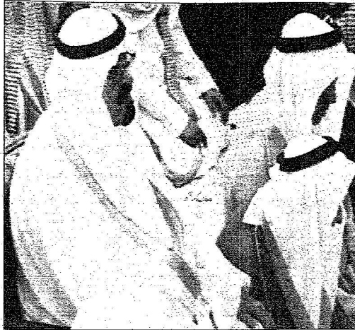
تشرف خادم الحرمين على الصلاة في المسجد