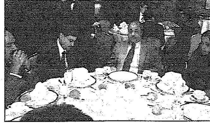
السفير الجديع والمستشار سلام

الكثير من المناصب الهامة في الداخل أو الخارج، كما أنها احتلت مكانة اجتماعية ومهنية مميزة ففكر أ وطاء وإنتاجاً. والمرأة السعودية تحظى بمساندة ورعاية كريمة من حكومة خادم الحرمين الشريفين وسمو ولي عهده الأمين - يحفظهما الله - ولعل هذا الدعم هو ما أتاح لها الفرصة كي تحتل مكانتها المستحقة والمطلوبة لخدمة الوطن والمشاركة الفاعلة في خطط التنمية الشاملة للبلاذ.