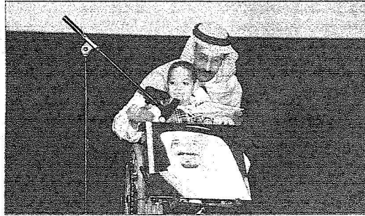
طفل معوق يلقى كلمته في الحفل وأمامه صورة سموه