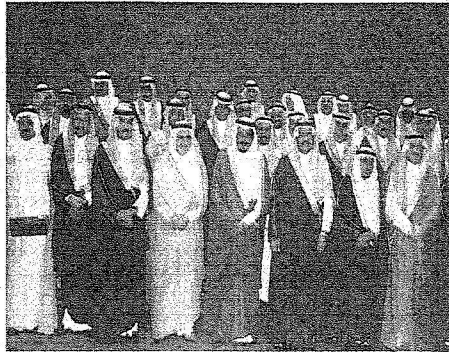
سموه في صورة جماعية مع الداعمين