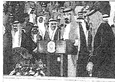
الملك يخاطب أبناءه منسوبي القوات المسلحة