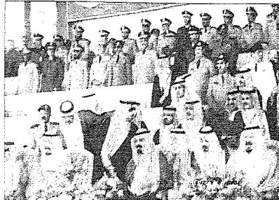
خادم الحرمين الشريفين وسمو ولي العهد خلال العرض