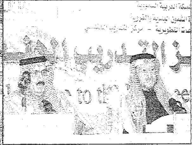
الامير منصور يتحدث في افتتاح الوردية

والاوضاع بالمعصم، ومشروع امتداد جسر الملك خالد شمالا وجنوباً لتسهيل حركة النقل بين المشاعر، وغيرها من المشروعات التي بلغت تكلفتها خلال العشر سنوات الماضية ما يقرب من ١٥ مليار ريال، ثم كان هذا المشروع الضخم والفريد من نوعه مشروع تطوير جسر ومنطقة الجمرات لتكتمل منظومة الأمن والسلامة لحجاج بيت الله