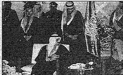
خادم الحرمين الشريفين - رحمه الله - ينتقل قصر الحكم بعد إعادة البناء