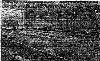
المقاعة الملكية بقصر الحكم حيث يلتقي الملك بالمواطنين