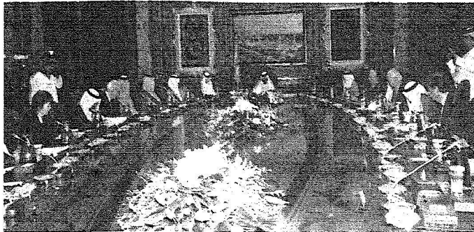
خادم الحرمين الشريفين خلال ترؤسه اجتماع مجلس أمناء جامعة الملك عبد الله للعلوم والتقنية.

الرياض - واس: أكد خادم الحرمين الشريفين الملك عبد الله بن عبد العزيز الرئيس الفخري لمجلس أمناء جامعة الملك عبد الله للعلوم والتقنية أن الهدف من إنشاء جامعة الملك عبد الله للعلوم والتقنية هو التأسيس لقيام معرفي يهدف لترويج مصادير اقتصادنا الوطني، وأن تكون جسرا للتواصل بين الحضارات وأن تؤدي رسالتها الإنسانية مستجيبة بالله تم بالعقول الثيرة في كل مكان.