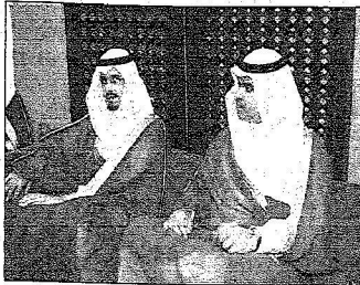
تصوير - حسين حمدي