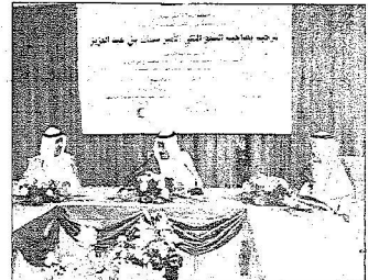
الأمير سلمان خلال رعايته للقاء