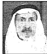
الشيخ سلامة بن هرماس