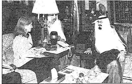
خادم الحرمين مستقبلاً تاوونست