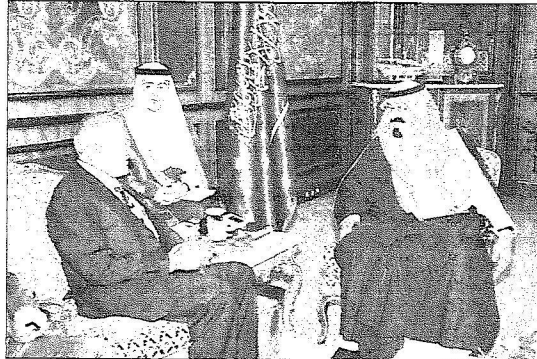
خادم الحرمين لدى استقباله الوزير السيريلانكي أمس